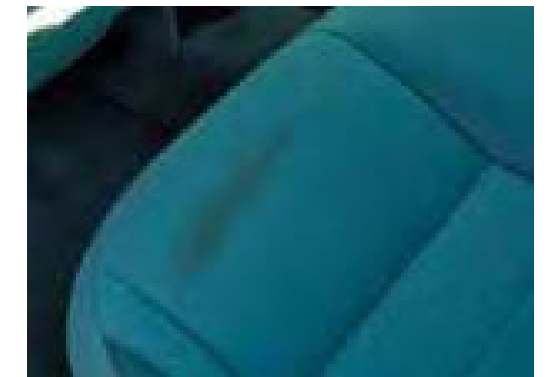
Een interieur dat zo vuil is dat reiniging of reparatie noodzakelijk is