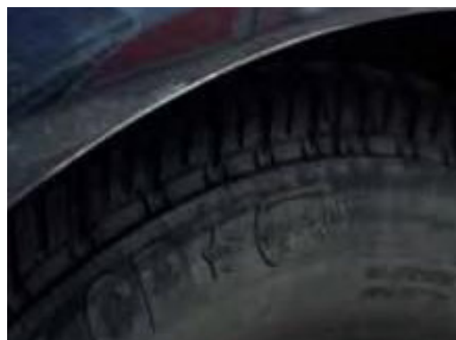
Een kras tussen de 2 en 10 cm