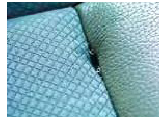
Scheuren, gaten of krassen in het auto-interieur