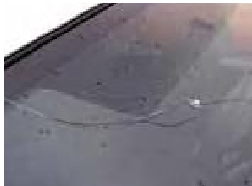
Krassen op de voorruit of steenslagschade