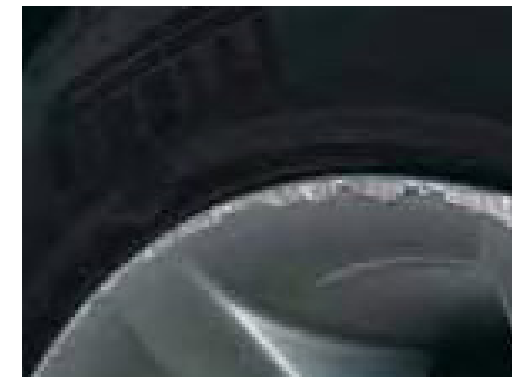
Gebarsten of gekraaste velgen of wioldoppen