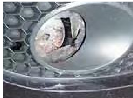
Een scheur of een gat in een koplamp of mistlamp