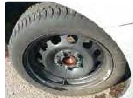
Ontbrekende wioldoppen of velgen