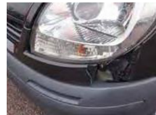
Gebroken, gebarsten, vervormde of losgelaten bumpers, grills of stootstrips