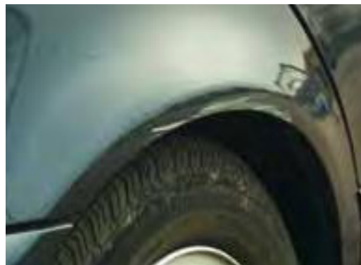
Krassen tussen de 2 en 10 cm in een grotere hoeveelheid dan aanvaardbaar geacht