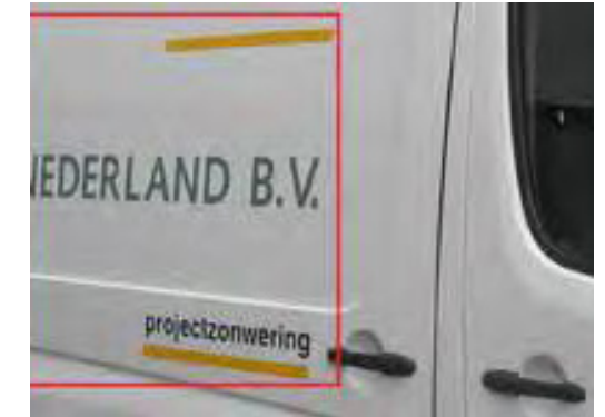
Reclame op voertuigen

Alle reclame op voertuigen, gespoten of geplakt, wordt beoordeeld als onaanvaardbare schade. Omdat alle ex-leaseauto's worden doorverkocht, willen wij voorkomen dat deze voertuigen met reclame-uitingen in omloop komen. Wanneer je ervoor kiest om deze reclame door ons te laten verwijderen, dan zullen er kosten in rekening worden gebracht. Indien de reclame reeds verwijderd is bij inlevering van het voertuig worden er geen kosten doorbelast, tenzij er lakschade of kleurverschil wordt geconstateerd.