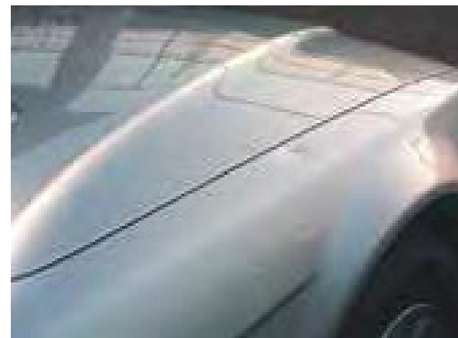
Deukjes van meer dan 2 mm diep, of groter dan een muntstuk van 50 eurocent