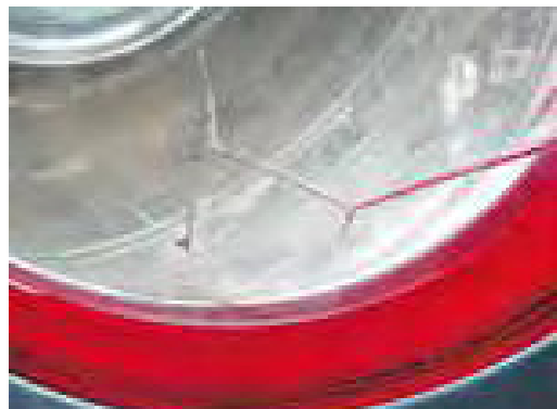
Een gebarsten voorruit met een begin van scheurvorming