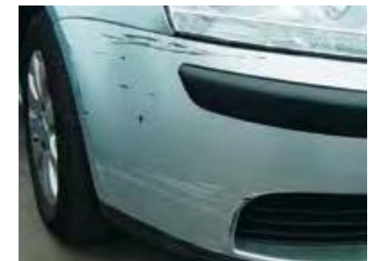
Beschadigingen op deze onderdelen groter dan een creditkaart