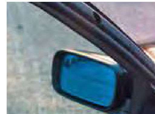
Beschadigingen aan interieur door gedemonteerde accessoires