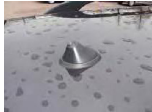
Een ontbrekende of verwijderde antenne