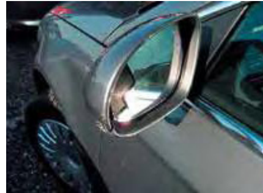
Afgerukte of loshangende spiegels