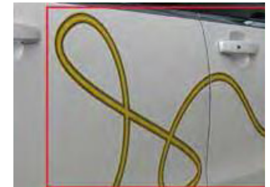
Reclame op voertuigen